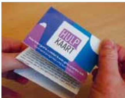
Voorbeeld van een Hulpkaart

Spannende ontwikkelingen: naast de crisiskaart komt er ook een #hulpkaart. Deze gaat de #crisiskaart niet vervangen deze is voor mensen met een psychische kwetsbaarheid. De hulpkaart is er voor iedereen die dat nodig heeft (zonder crisisplan).